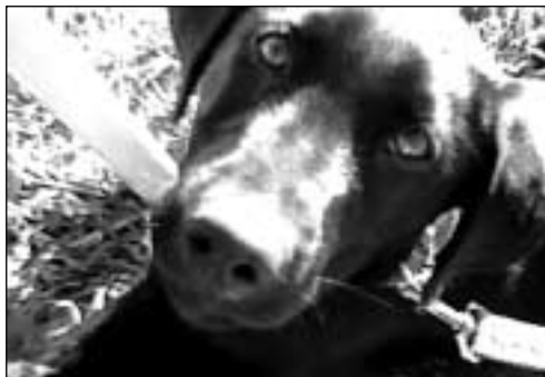
Teo Perelsztein es un labrador negro que hace las delicias de la familia, en su hogar platense.

Pueden enviar fotos, cartas y anécdotas de mascotas a " Planeta Beagle ", Virrey Loreto 3754 2° A (1427) Cap. Fed. o por E-mail a planetabeagle@yahoo.com.ar