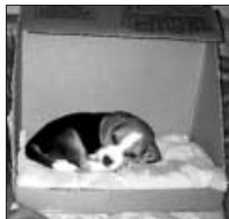
Paola nos acercó a Gaspar Melón, su pequeño beagle tricolor de 10 meses.