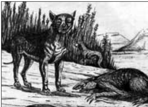
ILUSTRACIONES: EL PERRO, DE EDUARDO PRIDA

Según coinciden varios investigadores de la etología canina, los perros en la vida salvaje no ladran; lo hacen como resultado de un fenómeno social, producto a la necesidad de la comunicación con su mejor amigo (el hombre). No por el hecho de ser mudos eran menos afectivos o comunicativos con su amo. Contaban en sus crónicas los colonizadores que eran, el nativo y el mudo, una pareja perfecta a la hora de cazar o de realizar otras labores.