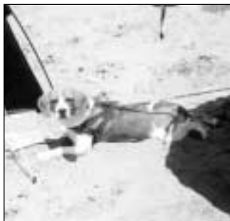
Quillen, una hermosa beagle de un año, aquí pasando sus primeras vacaciones en Mar de Ajó.