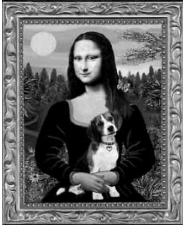
El beagle: una verdadera obra de arte.

TEMPERAMENTO: Es amable y vigilante, no muestra agresividad ni timidez.