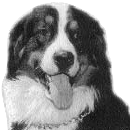
*Algiz de la Séptima Sala" (Arthos Vom Gramont) x (Queen Von Wachon)

Por suerte han surgido nuevas ocupaciones para las cuales el este, tiene excepcionales aptitudes. Su fino olfato, su inteligencia y esa extraña manera de querer estar comunicado con su dueño mediante posturas, miradas y actitudes no muy comunes en otros perros, hacen del Boyero de Berna un perro apto para muchas actividades.