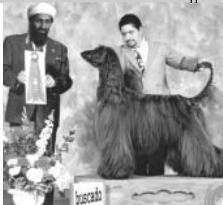
Del criadero Laden, sale un ejemplar destacado.

Tiene en grado sumo eso que los entendidos llaman una personalidad «asiática». El afgano tiene algo de felino, y no solo en su talante o en sus actitudes: prefiere vivir su propia vida a entregarse en cuerpo y alma a su dueño. Tranquilo y silencioso, ignora a quienes no le presteh atención. No hay que pensar por ello que el galgo afgano sea desdenguado y siempre reservado. Este perro también sabe ser un acompañante alegre y lúdico, afectuoso sin ser cargoso ni sumiso. Muy intuitivo, con un sentido de la inicia-