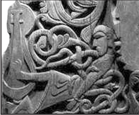
Gunnar y la Serpiente.

Detalle de la puerta de la Iglesia de Setesdal, Noruega.